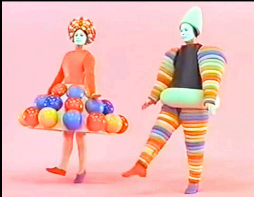
Oskar Schlemmer, Le Ballet triadique