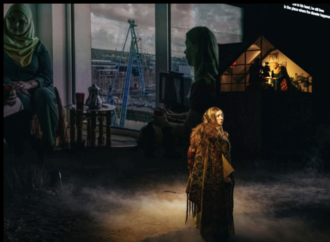
Milo Rau, Medea's Children