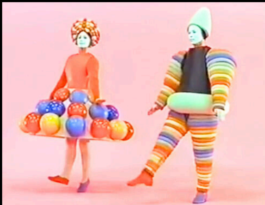
Oskar Schlemmer, Le Ballet triadique