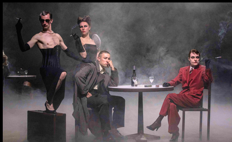
Sylvain Creuzevaut, L'Esthétique de la résistance