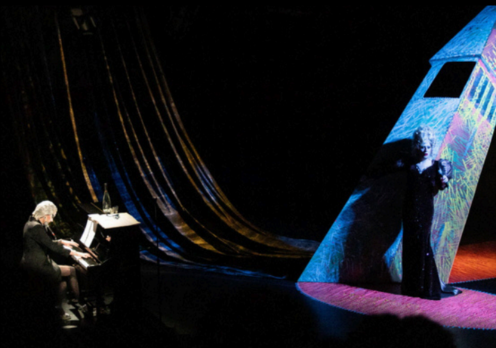
Sacha Vilmar, Cinq peurs et trois espoirs