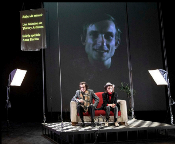
Animal Architecte, Bandes