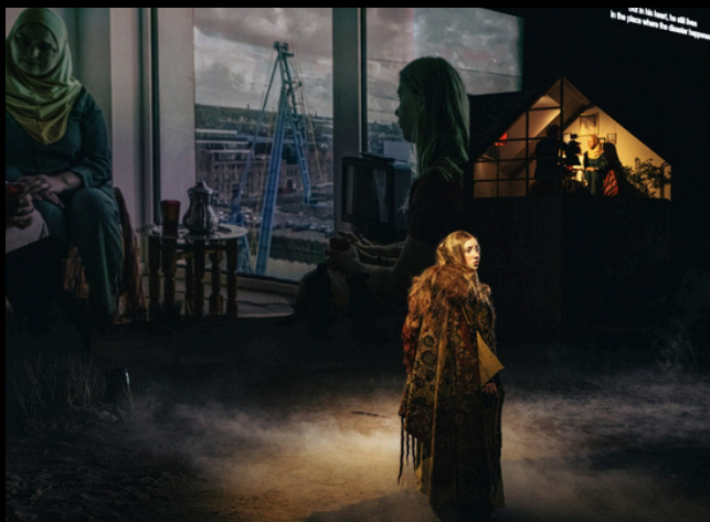
Milo Rau, Medea's Children