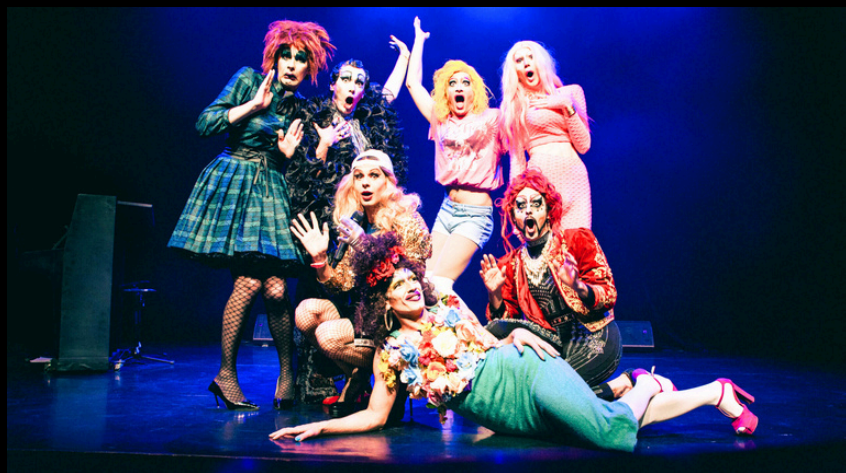
Les Douze Travelos d'Hercule